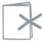
Einlage nicht bündig eingelegt