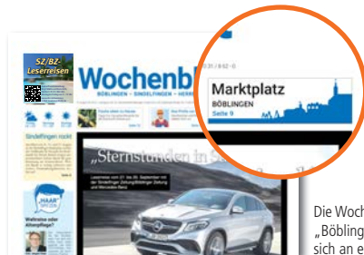
Die Wochenblatt-Teilausgabe „Böblingen und Schönbuch“ richtet sich an ein kaufkraftstarkes Publikum