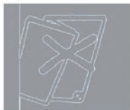
Mangelhafte Verarbeitung Falten, Eselsohren