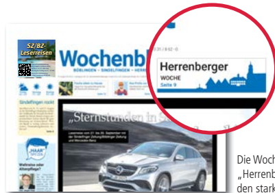
Die Wochenblatt-Teilausgabe „Herrenberger Woche“ für den starken Süden