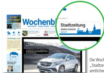
Die Wochenblatt-Teilausgabe „Stadtzeitung Sindelfingen“ mit amtlichem Teil der Stadtverwaltung