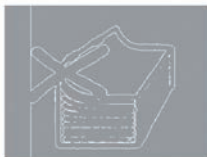
Papier zu dünn – Klammerung trägt auf